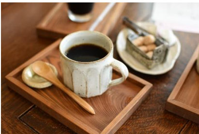
オリジナルブレンドコーヒー 「カフェクラシックブレンド」