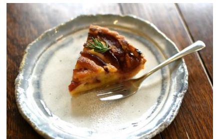
季節のフルーツなどを使った 手作りケーキ