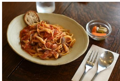
手作りトマトソースの生パスタ セットメニューあり(14時まで)